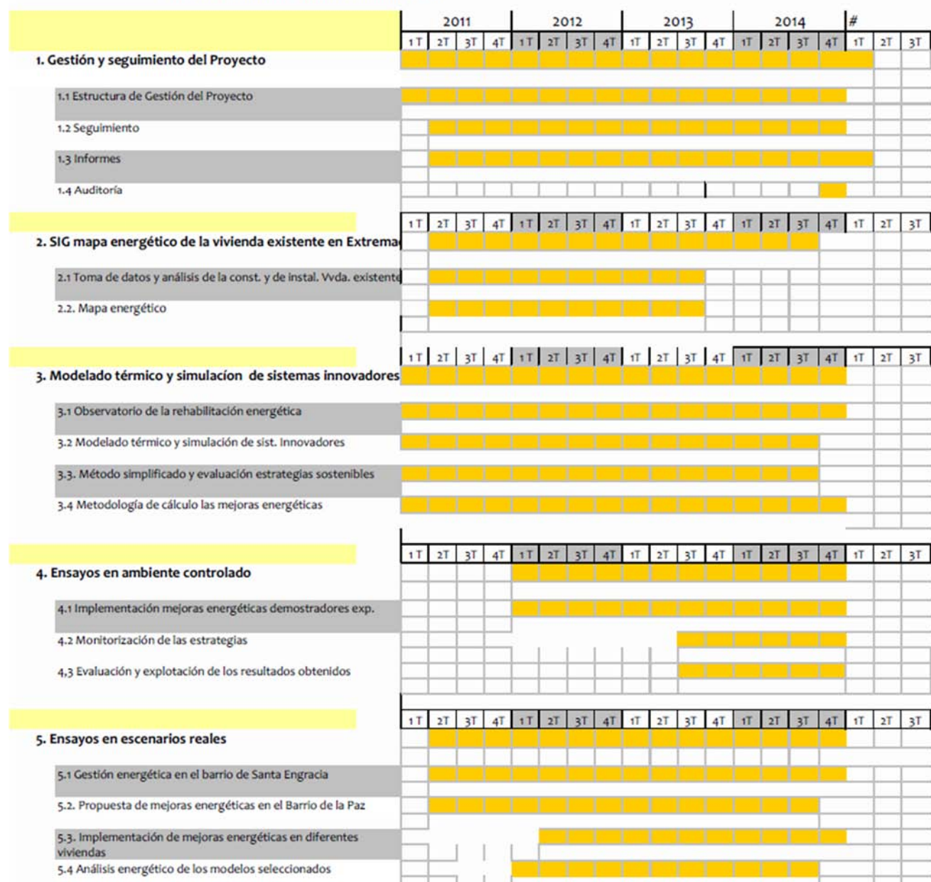
Informe de cambio CRONOGRAMA PROYECTO EDEA RENOV